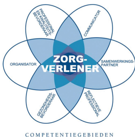
Figuur 1. CanMEDS-systematiek

Deze worden uitgewerkt aan de hand van de CanMEDS-systematiek (Canadian Medical Education Directives for Specialists). Deze systematiek bestaat uit zeven verschillende rollen. De kern van de beroepsuitoefening is de verpleegkundige als zorgverlener. Alle andere rollen zijn ondersteunend voor de rol van zorgverlener. Deze centrale rol geeft richting aan de andere CanMEDS-rollen.