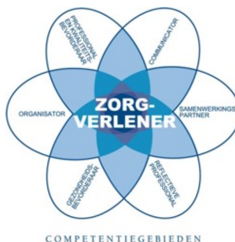
Figuur 1. CanMEDS-systematiek

Deze worden uitgewerkt aan de hand van de CanMEDS-systematiek (Canadian Medical Education Directives for Specialists). Deze systematiek bestaat uit zeven verschillende rollen. De kern van de beroepsuitoefening is de verpleegkundige als zorgverlener. Alle andere rollen zijn ondersteunend voor de rol van zorgverlener. Deze centrale rol geeft richting aan de andere CanMEDS-rollen.